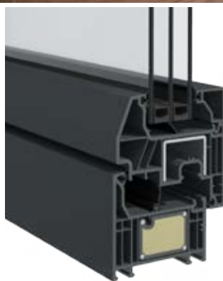
Elegant Origin 76 X (półtłoczone)