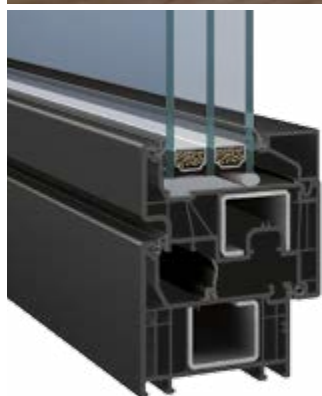
Elegant Abstract 76 X (zlicowane)