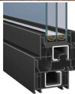
Elegant Infinity 76 X (niezlicowane - proste)